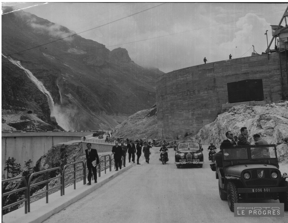
Barrage hydroélectrique de Tignes, 1951