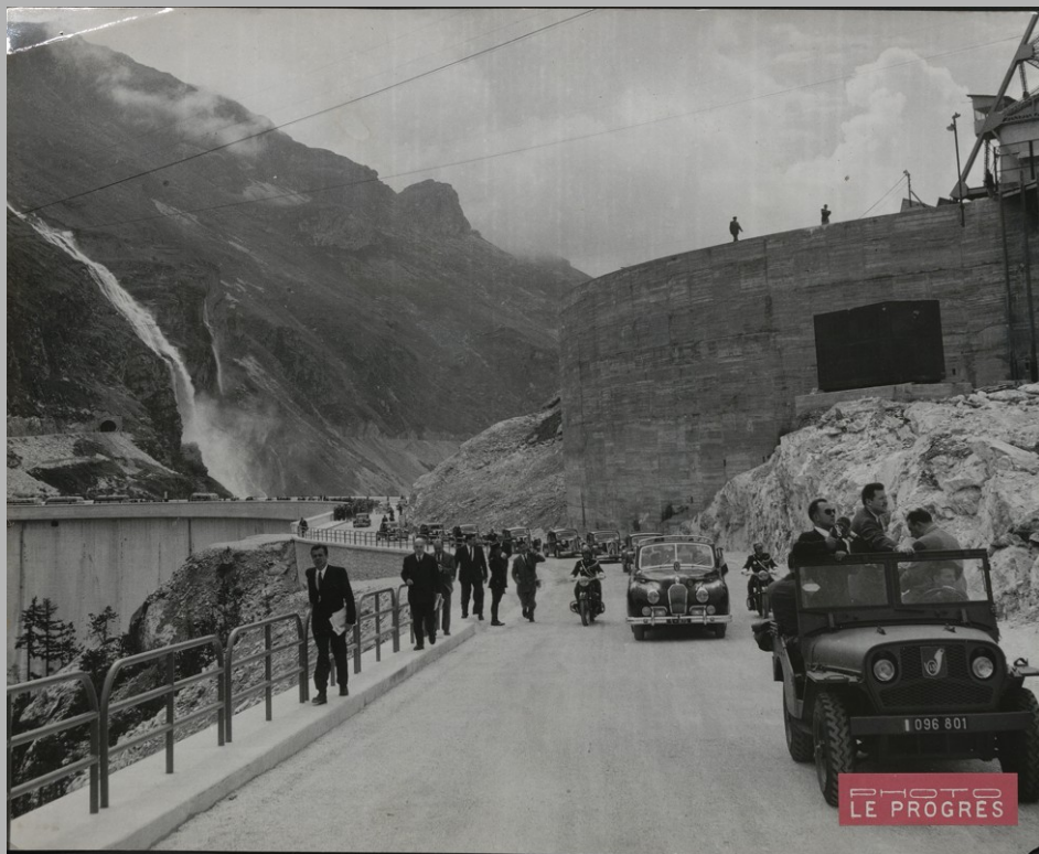
Barrage hydroélectrique de Tignes, 1951