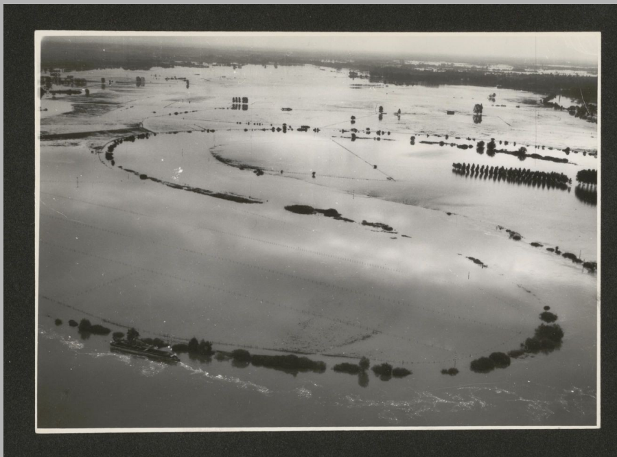
La Saône en crue lors de l'été 1968, vue aérienne

La Saône en crue lors de l'été 1968, vue aérienne. " l'été 1968 ? A peine croyable"