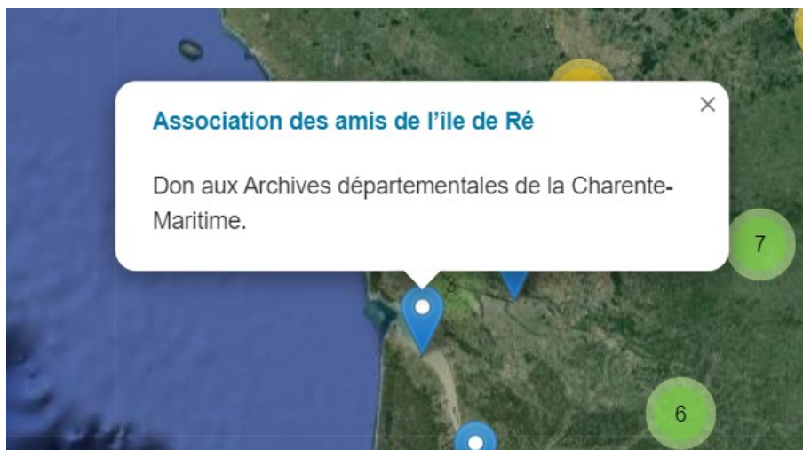
Géolocalisation des fonds d'archives concernant la Charente-Maritime

https://ressources.histoire-environnement.org/Carte?filtre=ressources