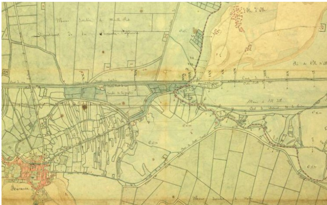
Date -vers 1835 3 S 244-1